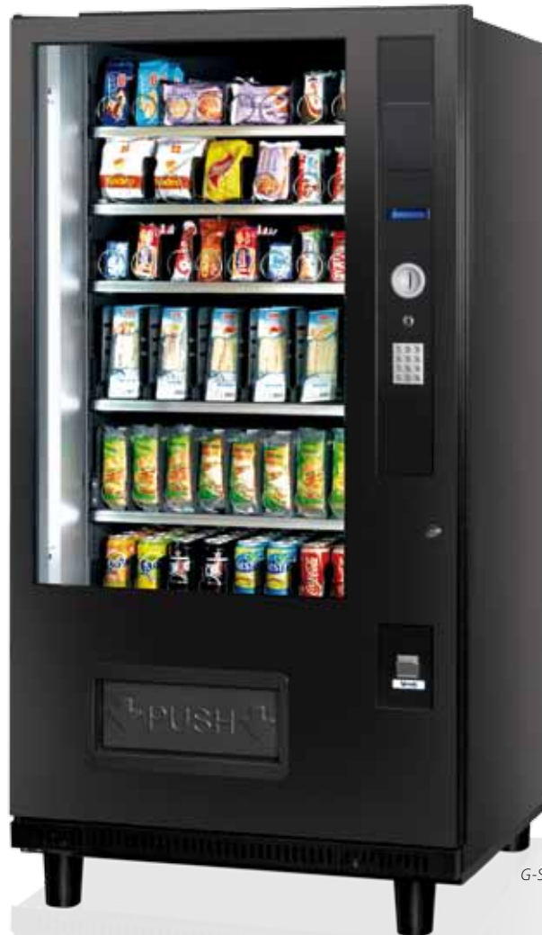
G-Snack Plus 8 Master